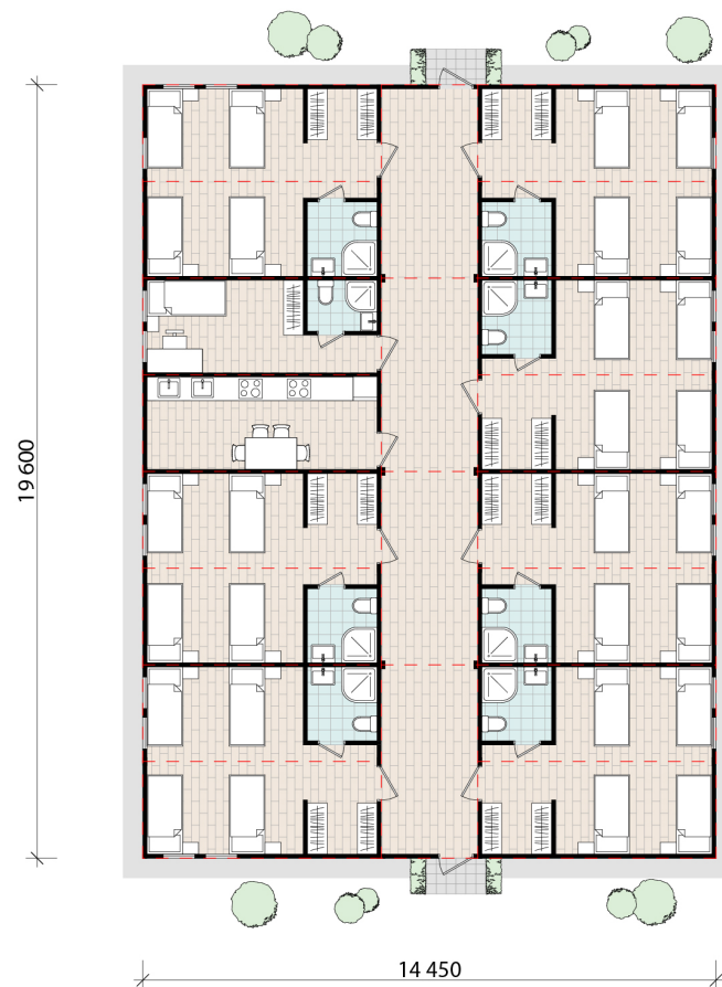
Общезитие К4.М6 283 м 2